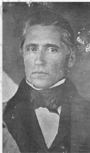
Paweł Edmund Strzelecki

W 2023 r. przypada 150. rocznica śmierci Pawła Edmunda Strzeleckiego. Był on wybitnym badaczem, podróżnikiem, odkrywcą i filantropem. Jako pierwszy Polak okrążył samodzielnie kulę ziemską. Badał tereny Ameryki Północnej i Południowej oraz Australii, Nowej Zelandii i Tasmanii. Dokonał tam wielu odkryć, a najwyższy szczyt kontynentu australijskiego nazwał Górą Kościuszki (Mount Kosciuszko) na cześć przywódcy insurekcji z 1794 r. Odkrył i nazwał także najżyźniejszy rejon rolniczy Australii – Gippsland. Po powrocie do Europy zamieszkał w Zjednoczonym Królestwie, gdzie został członkiem prestiżowych towarzystw naukowych. Angażował się także w działania dobroczynne, między innymi, działając na rzecz dożywiania dzieci w okresie Wielkiego Głodu w Irlandii.